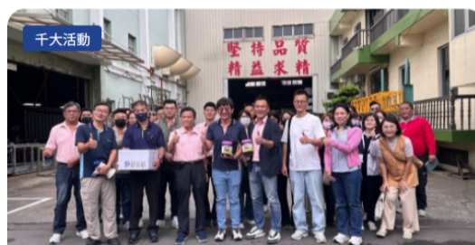
技術參訪 | 皇鑑實業鋁材表面處理廠 鋁材質感真實力 2025-11-07