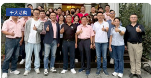
技術參訪 | 欽大玻璃 探索智慧製程與職人工藝 2025-11-13