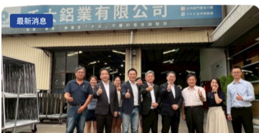
歡迎 YKK AP 蒞臨參訪千大鋁業 2025-09-10