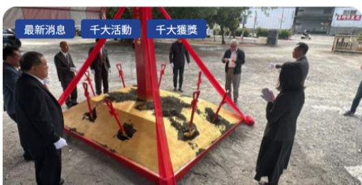
千大鋁業 台中石岡新廠開工動土 2025-12-17