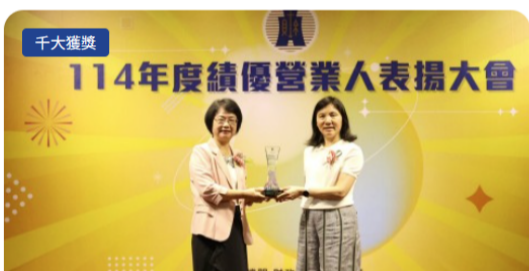
千大鋁業 榮獲 財政部中區國稅局「114年度績優營業人」... 2025-09-15